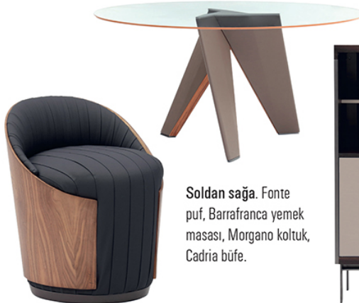
Soldan sağa. Fonte puf, Barrafranca yemek masası, Morgano koltuk, Cadria büfe.